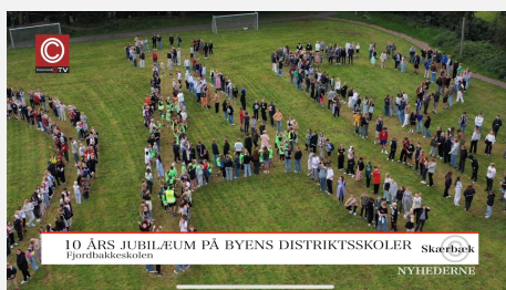
Festdag i anledningen af Fjordbakkeskolens 10 års jubilæum