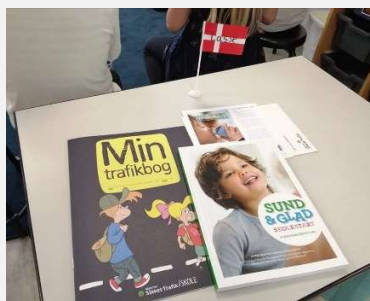
Skolestarterne i Taulov og Skærbæk blev budt velkommen på deres 1. skoledag