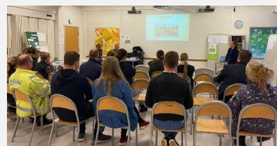
God stemning i Samlingsalen

Der var god stemning og spørgelyst fra de deltagende forældre. Nu afventer vi så de sidste tilmeldinger - både til skole og Forårs SFO.