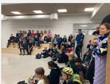
Motionsdagen handlede både om sved på panden og om samarbejde