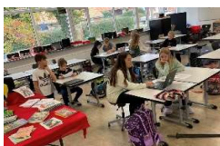
2. årgang fra Skærbæk har arbejdet med eventyr